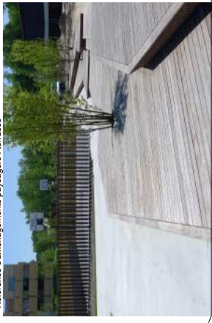
Transformation en jardin de la Highline New York - Diller Scofidio + Renfro